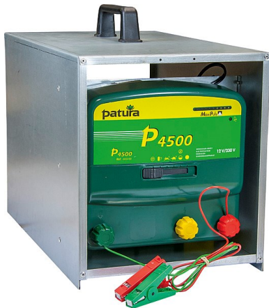
P 4500 mit Tragebox Art. Nr. 1984-2