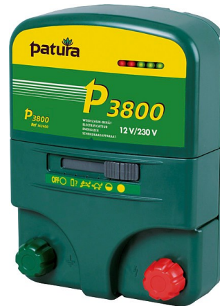
P 3800 mit Tragebox Art. Nr.: 2069-2